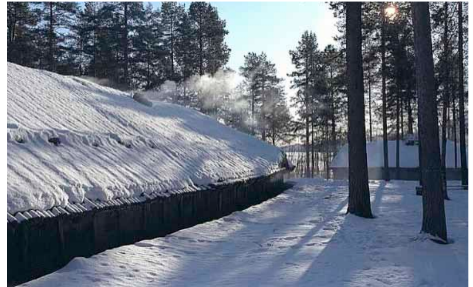
KUVA 5. Rautakautisen talon rekonstruktio Genen muinaiskylässä Ruotsissa

Arkeologit ovat perinteisesti jakaneet esihistorialliset ihmiset eri kulttuureihin mm. saviastioiden muodon perusteella. Nykyisin jakoa pidetään keinotekoisena, ja monet tutkijat korostavatkin enemmän, että eri kulttuurit olivat keskenään jatkuvasti tekemisissä kehittäen kuitenkin omat alueelliset erityispiirteensä. Saviastioiden muodon perusteella on erotettu esimerkiksi ”kuoppakeraamisia” ja ”kampakeraamisia” kulttuureita, jotka itse asiassa olivat saman kivikautisen kulttuurin ilmenemismuotoja eri alueilla. Yhteensä Pohjoismaissa, Itä-Euroopassa ja Baltiassa erotetaan jopa yli 30 eri kuoppa- ja kampakeraamista kulttuuria. Joskus on jopa väitetty, että kukin keramiikkakulttuuri muodostaisi oman kansansa, mutta nykytutkijoiden mielestä pelkkien saviastialöytöjen perusteella ei voi sanoa, mikä rautakautinen kulttuuri kuului mihinkin kansaan.