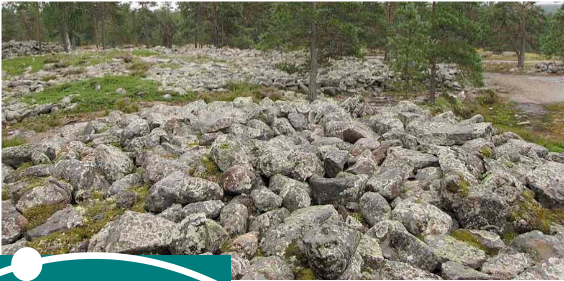
KUVA 4. Sammallahdenmäen pronssikautinen rökkiöhauta Raumalla