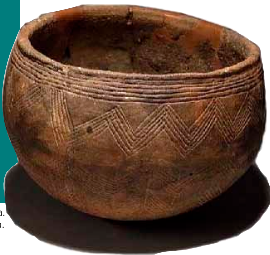
KUVA 3. Saviastia nuoremmalta kivikaudelta. Astia on löydetty Itä-Götanmaalta Ruotsista.

erityispiirteensä. Saviastioiden muodon perusteella on erotettu esimerkiksi ”kuoppakeraamisia” ja ”kampakeraamisia” kulttuureita, jotka itse asiassa olivat saman kivikautisen kulttuurin ilmenemismuotoja eri alueilla. Yhteensä Pohjoismaissa, Itä-Euroopassa ja Baltiassa erotetaan jopa yli 30 eri kuoppa- ja kampakeraamista kulttuuria. Joskus on jopa väitetty, että kukin keramiikkakulttuuri muodostaisi oman kansansa, mutta nykytutkijoiden mielestä pelkkien saviastialöytöjen perusteella ei voi sanoa, mikä rautakautinen kulttuuri kuului mihinkin kansaan.