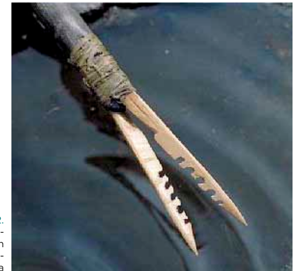
KUVA 2. Varhais- kivikautinen atrain Etelä- Ruotsista